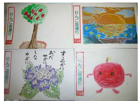
昨年度の作品より