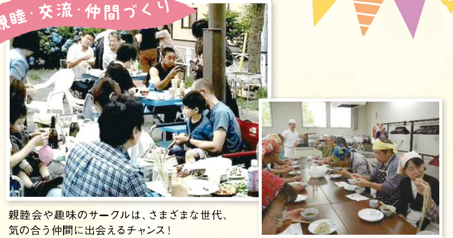
親睦会や趣味のサークルは、さまざまな世代、 気の合う仲間に出会えるチャンス！