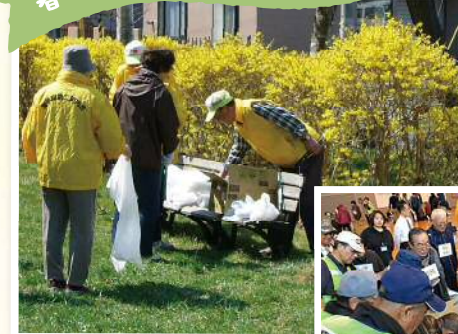
住んで良かったまちは、一人ひとりの 優しさと思いやりでつく られます