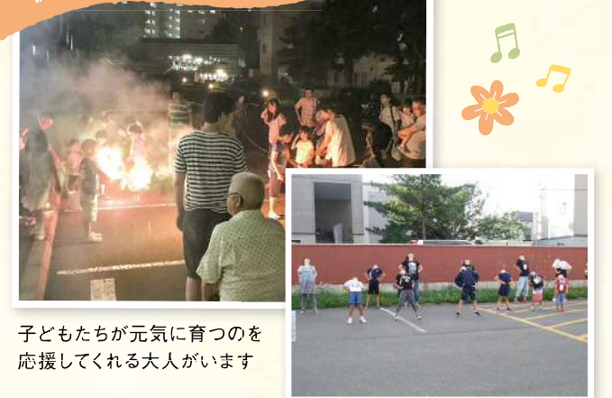
子どもたちが元気に育つのを 応援してくれる大人がいます