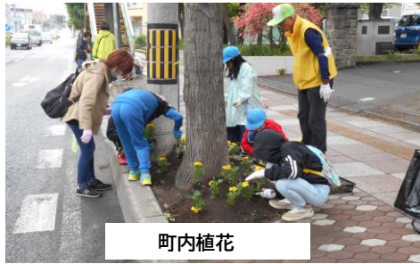
今年の予定事業の一例