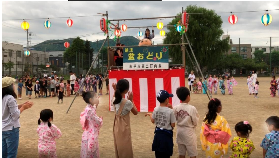
平岸小グラウンド

ラジオ体操・夏まつりのお手伝いできる方募集中! 総務部長 ☎090-1303-4430 にお申し出くだ