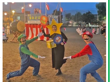
昨年の仮装盆踊り

平岸小ご近所の皆様へ 夏休みラジオ体操と夏まつり開催のため、朝方と夕方に 大きい音を出すこととなりますが、ご理解とご協力をお願いいたします。