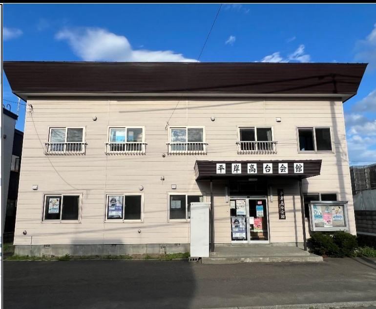
所在地 札幌市豊平区平岸5条13丁目3-25