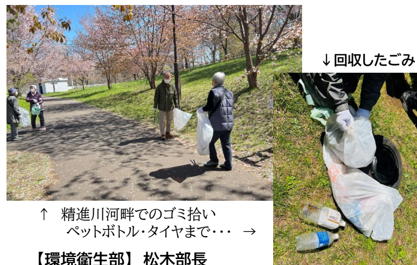
↑ 精進川河畔でのゴミ拾い ペットボトル・タイヤまで... →

桜を楽しみながら、精進川河畔の清掃、地域清掃、その後 町内会交流タイムで楽しみました。